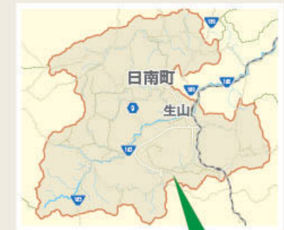
日南町福塚 宮田集落

日南町宮田集落は、耕地面積13ヘクタール、13戸の集落です。隣接集落には農事組合法人が設立されており、「宮田もまとまりが必要」ということから、共生の里に取り組みことになりました。作り手が見つからず、集落で管理する水田があり、初年度はこのほ場の耕うん、草刈や鳥獣侵入防止柵の設置を協働活動で行うこととしました。