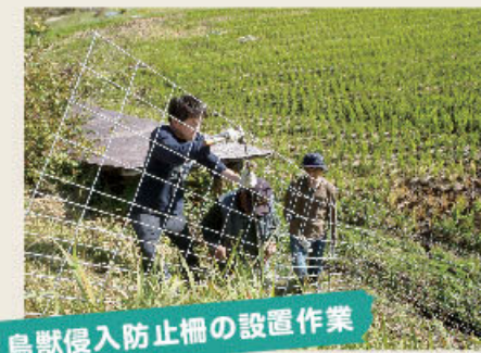
鳥獣侵入防止柵の設置作業

普段食べられないごちそうに企業側の参加者も大満足。作業場で、総勢60名を超えるランチ会となりました。