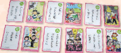
「共同参画かるた」絵札は日野町の就労継続支援事業所「セルブひの」が担当。