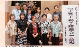
「上野千鶴子講演会」(H29.9.10 日野町文化センター)

「男女共同参画推進会議ひの(つくしんぼの会)」は、平成12年に発足、現在は40代から80代までの11名のメンバーが、日野町を誰もが住みやすいまちにするため、講演会や研修会などの活動を行っています。