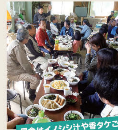
昼食はイノシシ汁や香たくご飯

日南町宮田集落は、耕地面積13ヘクタール、13戸の集落です。隣接集落には農事組合法人が設立されており、「宮田もまとまりが必要」ということから、共生の里に取り組みことになりました。作り手が見つからず、集落で管理する水田があり、初年度はこのほ場の耕うん、草刈や鳥獣侵入防止柵の設置を協働活動で行うこととしました。