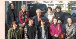
県外視察研修(H30.10.31 エスポール出張クリニック) ※会員以外の方も参加

今年4月には、一般の方から募集した文字札を使った「共同参画かるた」が完成。かるたを貸し出し啓発に繋げるなど新しいアイデアを取り入れながら、男女共同参画について、家庭や自治会でみなさんにもっと身近なこととして考えていただくために頑張っています。